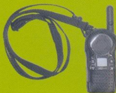
Estojo de Couro com Correia Ajustável Código: 56519