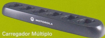
Carregador Múltiplo para 6 Unidades Código: 56531